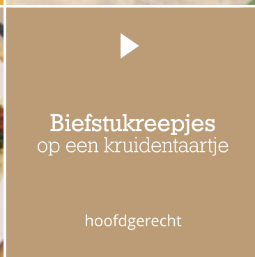
Biefstukreepjes op een kruidentaartje