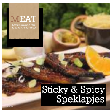
Sticky & Spicy Speklapjes

Op de achterzijde van dit formulier kun je aangeven welke receptkaartjes je wilt bestellen.