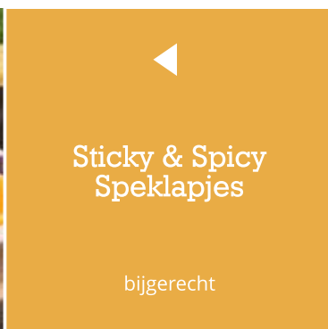
Sticky & Spicy Speklapjes