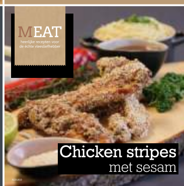
Chicken stripes met sesam