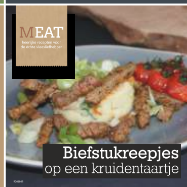
Biefstukreepjes op een kruidentaartje