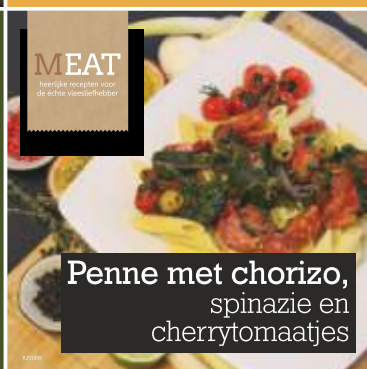
Penne met chorizo, spinazie en cherrytomaatjes